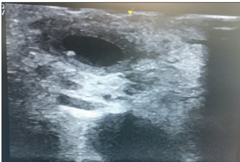
Figura 1. Ecografía abdominal. Dilatación conducto de Wirsung y patrón colestásico biliar.