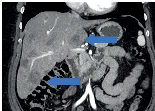
Figura 1. TC abdominal con lesiones hepáticas multifocales.